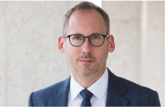
Kai Klose Staatsminister für Soziales und Integration