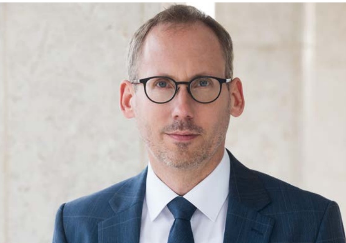
Kai Klose Staatsminister für Soziales und Integration