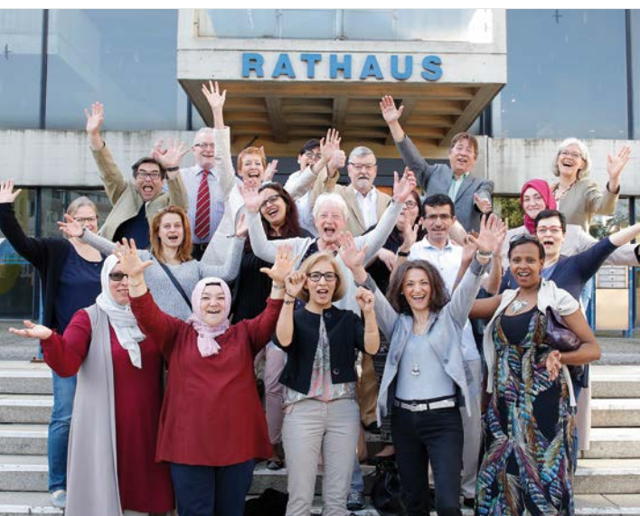
Große Freude vor dem Offenbacher Rathaus, die erste WIR-Lotsengruppe des Freiwilligenzentrums ist qualifiziert.

Lernprozesse können auf unterschiedlichen Wegen vorangetrieben werden. Zunächst sind hier die im Rahmen des Landesprogramms WIR förderfähigen Vertiefungsseminare zu nennen. An vielen Projektstandorten gibt es darüber hinaus weitere Bildungsangebote, die für das Engagement als WIR-Integrationslotsin oder -lotse von Belang sind. Die Nutzung solcher Bildungsangebote ist eine gute Möglichkeit der Reflexion und (persönlichen) Weiterentwicklung (→ S. 14).