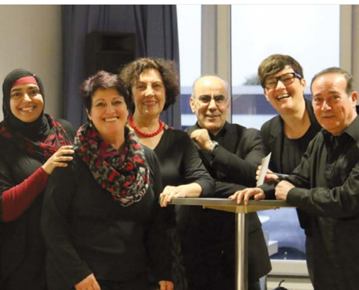
10 Jahre WIR-Integrationslotsinnen und -lotsen in Hattersheim – ein Grund, stolz zu sein.

Die Mitwirkung in einem WIR-Integrationslotsenprojekt eröffnet den ehrenamtlich Engagierten selbst vielfältige Möglichkeiten der persönlichen Weiterentwicklung. Zu nennen sind hier der Einsatz und die Weiterentwicklung vorhandener und der Erwerb neuer Kompetenzen, der Einblick in die Arbeit von Ämtern, Fachdiensten und sozialen Initiativen, in die (Aus-)Bildungsstruktur, das Gesundheitssystem. Ein weiterer Aspekt ist die Möglichkeit, neue soziale Kontakte zu knüpfen.