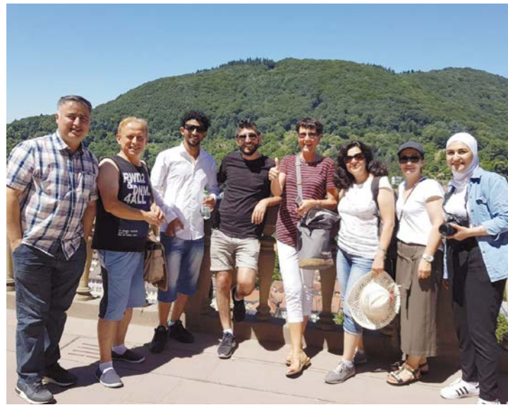
Die Lotsenteams aus Rodgau und Seligenstadt bei einem gemeinsamen Ausflug in Heidelberg.

Die Themen für Vertiefungsschulungen können gemeinsam mit aktiven WIR-Integrationslotsinnen und -lotsen gesammelt werden, um die tatsächlichen Bedarfe abzufragen.