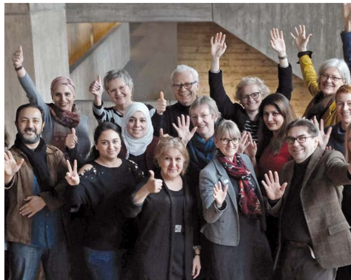
Glückwünsche des Landes und der Stadt Offenbach für die zweite WIR-Lotsengruppe des Freiwilligenzentrums.

Sie können – im Idealfall im gemeinsamen Gespräch mit Mitarbeiterinnen und Mitarbeitern in Ämtern sowie Fachdiensten und den Menschen, die gelotet werden – klären, welche Anrechte auf Integrationsleistungen sie möglicherweise haben. Sie können dabei z. B. deutlich machen, welche Anforderungen an sie gestellt werden, sei es hinsichtlich vorzulegender Dokumente oder anderer Verpflichtungen.