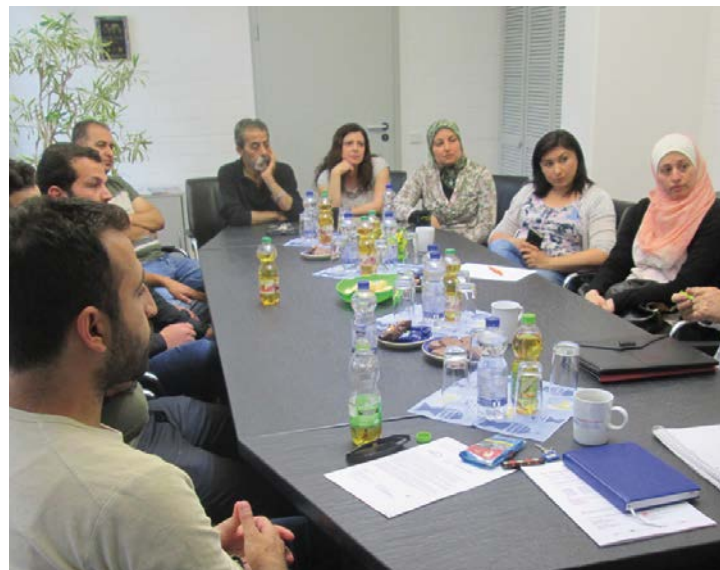
Intensiver Austausch der Integrationslotsinnen und -lotsen in Wetzlar beim Freiwilligenzentrum Mittelhessen.